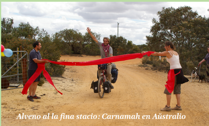
Alveno al la fina stacio: Carnamah en Aŭstralio

Bicikli en Aŭstralio estas tute alia afero ol en Azio, ne nur pro la homoj. Fakte, oni povus preskaŭ diri, ne estas homoj en Aŭstralio. Centoj da kilometroj sen domo, sen akvo, sen io, nur vojo, arbetoj, arboj, floroj, birdoj, ŝtonoj. En Azio mi malofte kuiris mem, plej ofte mi trovis malmultekostan restoracion, malofte mi dormis en mia tendo, plej ofte mi trovis malmultekostan hotelon. En Aŭstralio mi plej ofte kuiris mem, mi plej ofte dormis en mia tendo, ĉar plej ofte tute ne estas restoracio aŭ hotelo.